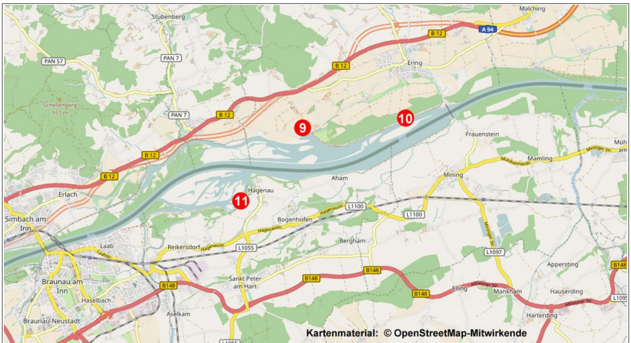
Beobachtungspunkte 9 – 11