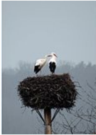
M1 - AXXY und Maxi